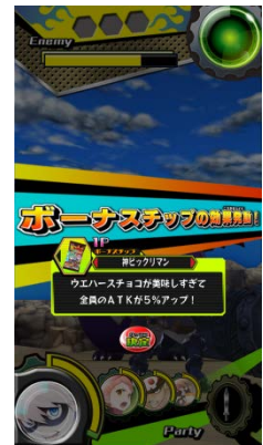
「神ビックリマンチョコ」で攻撃力アップ！