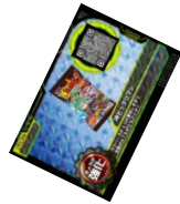
ボーナスステップ