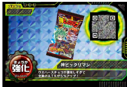
アイテム「神ビックリマン」