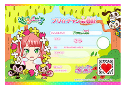
「モーリーファンタジーデザイン会員証」

また、今回初の試みとして「モーリーファンタジーデザインの会員証」も登場！ モーリーファンタジーのキャラクター達がプリントされた、特別な会員証 で、ゲームをプレイする際に購入することができます。