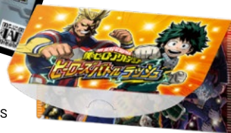
▼特製カードケース