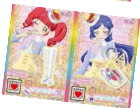
ティーパーティーブルーベリーコーデ