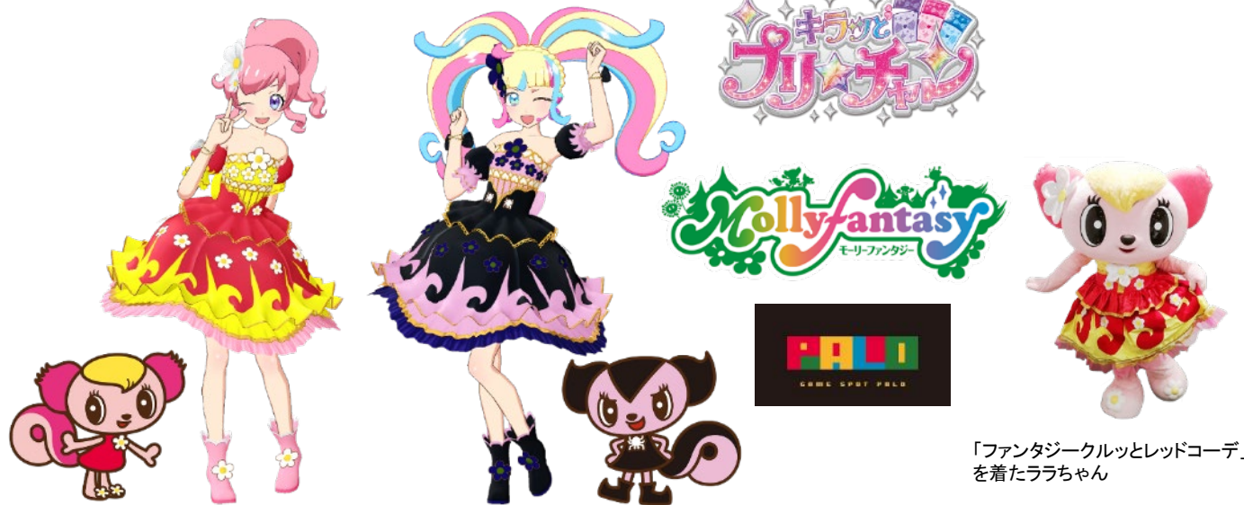
モーリーファンタジーオリジナルキャラクター「ララちゃん」