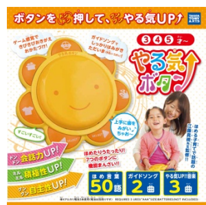
パッケージイメージ